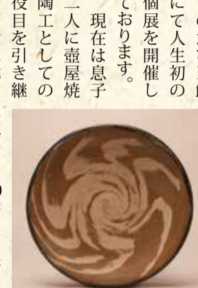
「練り込み皿」(2000年の九州・沖縄サミットで製作)