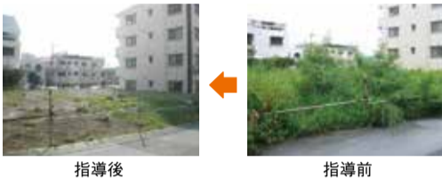
●あき地に関する相談・処理状況（平成27年度）

空き家や墓地は、土地が活用されていないことからあき地に該当しないため、条例の対象外となり指導ができません。