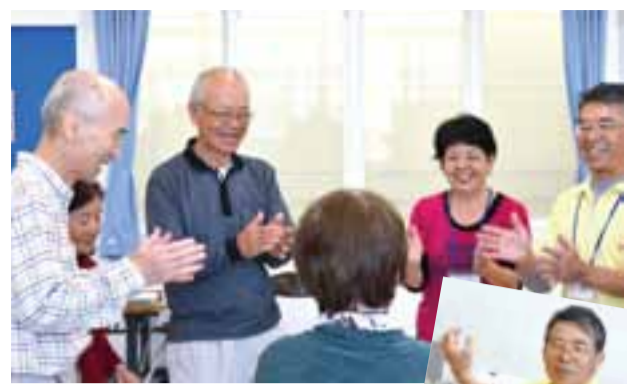
☆すみれの会☆ 3人のリーダーが役割を分担しながら、ちゃーがんにじゅう体操のほか、レクリエーションダンスやリズムダンスなどを取り入れています。「一番は楽しく」をモットーに笑い声の絶えない教室を開いています。

ストレッチ体操は、激しい運動は行わず、首や手首などを回したり、腕や関節、アキレス腱などを伸ばしたり