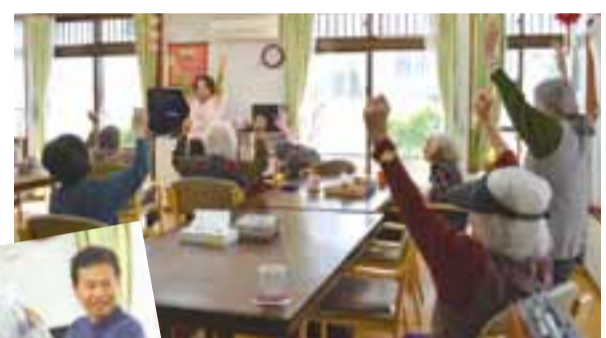
☆小規模多機能ホーム安岡☆ 家庭的でゆったりとした雰囲気の特徴の教室です。体操以外に新聞を読み上げながら身近で起こったことを紹介したり、記事の表題から連想するゲームをしたりと、地域に根差した居場所づくりをめざしています。