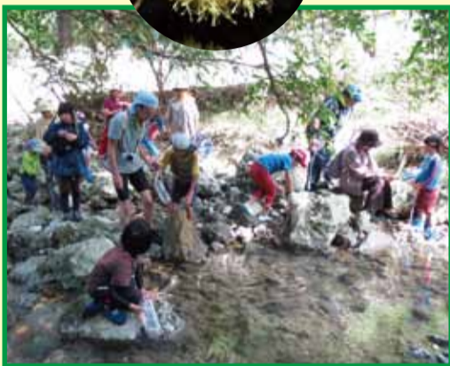
▲生き物調べの様子