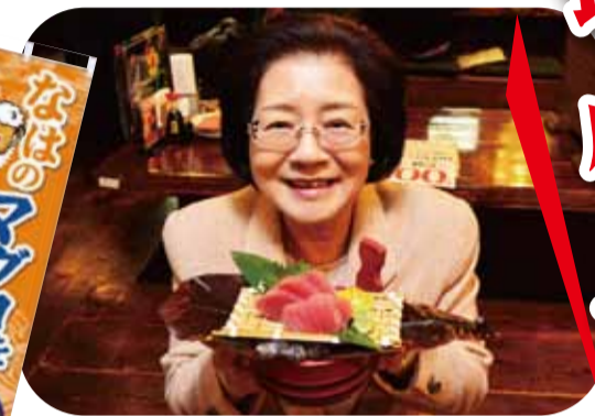
協力店：ちぬまん泉崎店

みなさん、「市の魚」がマグロであることはご存じですか？平成24年の漁港港勢調査において、那覇市(泊漁港)の生鮮マグロは、水揚量年間4007トン(沖縄県内水揚量の約54%)と県内でも随一の水揚量を誇っています。