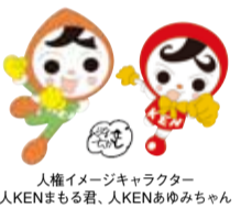
人権イメージキャラクター 人KENまもる君、人KENあゆみちゃん

那覇地方法務局および沖縄県人権擁護委員連合会では、職員や人権擁護委員が身近に起こる人権に関する相談を受け、問題を解決に導く取り組みを行っています。困ったことがあれば、ごなただでもお気軽にご相談ください。