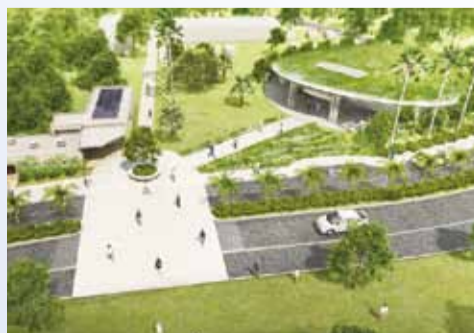
▲市民共同墓全景イメージ図