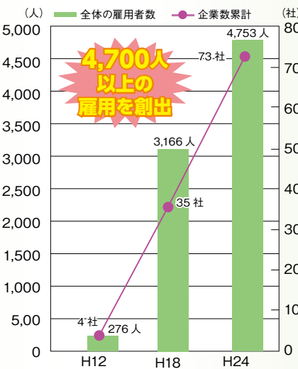
〈助成金交付企業数と雇用者数の推移〉

市では、雇用の拡大と産業の振興に寄与することを目的として、平成12年度より一定数・一定期間以上、那覇市民の新規常時雇用を行い、市内に事務所等を設置した企業などに対し、予算の範囲内で助成金の交付を行っています。助成金交