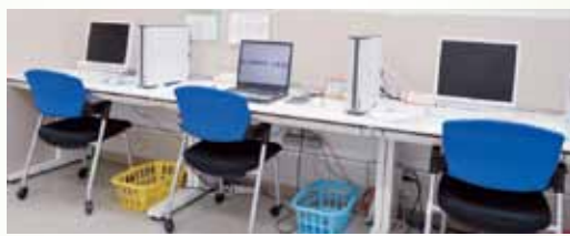
▲パソコンコーナー

同センターは、就職活動に役立つ各種支援セミナーやパソコン講座などを受講無料で開講したり、就職活動中の不安や悩みなどを専門相談員がサポートする就職相談なども行って、求職者がスムーズに就職できるようさまざまな支援をしています。利用者からは、「自分自身を見つめ直す、いい機会になった(40代女性)」「頭の整理がついて、前向きになれた(30代女性)」という声をいただいています。他にもハローワークの求人情報やインターネットを利用した情報の収集にも同センターをご利用ください(パソコン3台設置)。