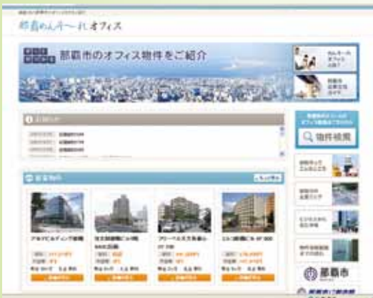
【那覇めんそ〜れオフィス】