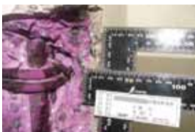
コンクリート中性化調査