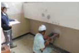
コンクリート強度調査