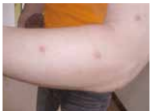
図2:刺されて赤く腫れた腕

主に夜間の就寝中に手足や首などから吸血され、繰り返し吸血されると激しいかゆみや発赤が生じます。