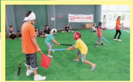
スポーツチャンバラ