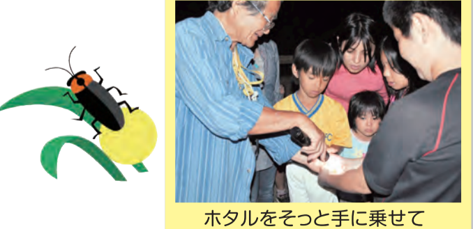
ホテルをそっと手に乗せて

日時: 5月16日(木)、23日(木) いずれも18時30分~20時30分 集合場所: 那覇市立「森の家みんな」 対象: 那覇市在住または那覇市在勤の方 定員: 各30名先着順(5月7日)より申込み開始! 参加料: 無料 持参する物: 長袖、長ズボン、運動靴