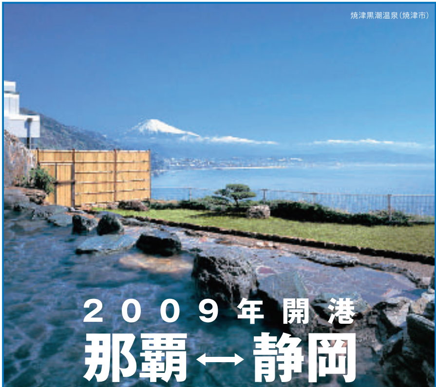
焼津黒潮温泉(焼津市)