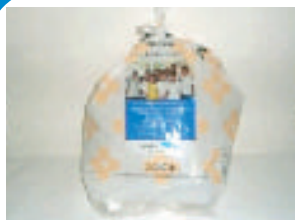
▲トイレトペーパーの袋