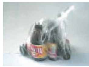
▲生鮮食品などの包装袋