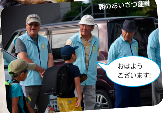
朝のあいさつ運動