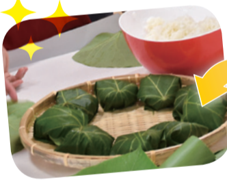
子どもの居場所づくり