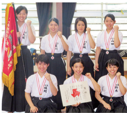
団体出場 首里高校の選手たち

演技競技で去年から「仕掛け」と「応じ」の役割を交代し、県大会で見事優勝を果たしたペア。息の合った先輩後輩コンビの演技競技は必見。