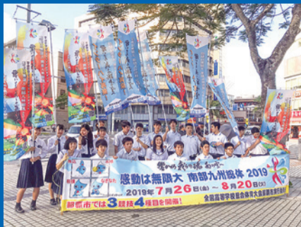
那覇商業高校水球部のみなさん