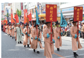
首里城祭での冊封使行列

このように、市には琉球王国のおもてなしの形を伝える有形・無形の文化財が数多く残されているのです。