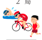
図 沖縄国際トライアスロン大会事務局 ☎867・2632