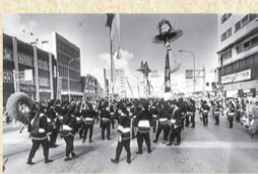
「市制施行50周年」を記念して行われた大綱まつり