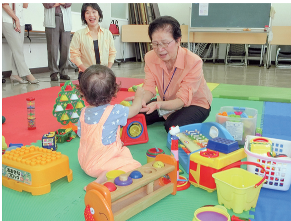
子育てサロン「まわしふあ〜かんだ」の活動の様子

づくり以外にも、民生委員児童委員の活動や、ボランティア団体への支援、福祉団体の事業支援に活用しているよ。