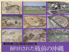
掘り出された戦前の沖縄

那覇市文化財課は市内各地で埋蔵文化財の発掘調査を行っており、近年では近世・近代期のムラや墓の調査が急増しています。今回、那覇市文化財課が近年実施した発掘調査成果を通して、沖縄の戦前から現代までの人々の暮らしや景観の変遷などを紹介します。なお、本展示会は沖縄県立埋蔵文化財センターを中心に、埋蔵文化財公開活用合同企画展として県内12市町村において、それぞれの発掘調査成果を紹介する一環で開催されます。（主催：那覇市文化財課）