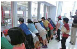
施設見学のようす

ごみ処理施設や資源化物の選別施設などを見学することで、ごみ減量・資源化について学ぶことができます。