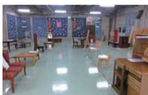
再生工房展示のようす

資源化物として出された衣類の中から、着用可能な状態の衣類をスタッフが厳選して販売しています。