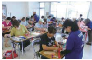
布ぞうり作製のようす

古着・古布を利用したリメイク・リユース講座(藍染め・草木染め・裂き織り・マイバッグ作りなど)や、生ごみ減量・堆肥化の展示を行い、希望者に随時ノウハウを提供しています。また、生ごみの様々な処理方法に関する講座も開催しています。