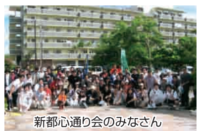
新都心通り会のみなさん

Q 活動内容はどのようなものですか? A ごみ拾いクリーンデーを2ヶ月に1回開催して、通り会を地域を中心に地域住民・団体の皆さんを中心に行っています。特に目立つのは段ボールやペットボトルなどのごみで公園内のテニスコート、バスケットコート周辺の自動販売機の横などです。 この他には、新都心安全なまちをつくる会が主催している新都心防犯パトロールに参加し、子どもたちの深夜徘徊防止のために地域のボランティアや青年会と一緒に、パトロールをおこなっています。