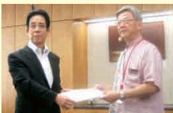
川端総務大臣に申出書を手渡す市長

中核市として、レベルアップ、スピードアップ、パワーアップする那覇市の新しい姿。新たに手にする「大きな力」で、市民サービスの充実に向けて取り組んでいきますので、これからも、ゆたさるぐと、うにげーさびら(よろしくお願ひします)。