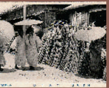
お盆前に開設されたサトウキビ市場

しかし、これらの風景は、1944年の10・10空襲やその後の地上戦により無残な姿となり、さらにアメリカ軍の占領・統治にもなるとなると、建設や生活スタイルの変化により変わっていったものとなりました。今年には沖縄戦終結からすでに67年が経過し、特にアメリカ軍の占領・統治から日本本土へ復帰して40年の節目の年にあたります。この間の都市