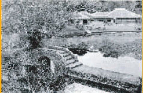
上:戦前の識名園。 右:1736年に編纂された冠婚葬祭の規式を記した『四本堂家礼』(部分)。朱線の部分に「清明」と見える。沖縄県教育庁文化課編『四本堂家礼 上』より