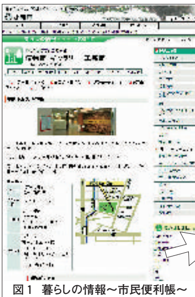
図1 暮らしの情報～市民便利帳～

「なかなか市役所に行く時間がつくれない」、「この手続きはどの窓口で取り扱っているの?」、こんな時は、那覇市ホームページを利用してみませんか? 那覇市ホームページでは、子育てや環境など、様々な市民サービス情報はもちろん、体育館などの公共施設の利用予約や、市立図書館