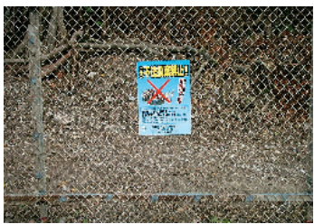
改善後：投棄されにくい状態

左の写真の場所では、管理前はごみ捨て場状態でしたが、草木を除去し、フェンスを設置することで改善