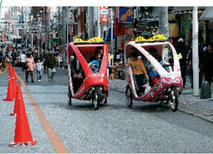
街中を歩いたり環境にやさしいベロタクシーを利用することで新しい発見があるかも