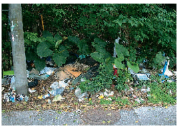
改善前：草木が繁茂し、投棄しやすい