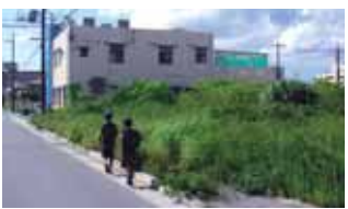
歩行の妨げになり危険な状態