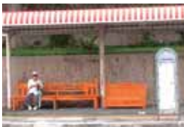
バスを待つ間のホッとするととき

12月からは、これまで燃やすことのできなかった廃プラスチック類や皮革・ゴム製品なども燃やして処理しますが、新ごみ処理施設は、ダイオキシン類を国の排出基準より大幅に下回る値まで除去できます。