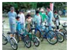
よみがえった自転車たち(去年の環境フェア)