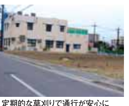
定期的な草刈りで通行が安心に

そのために、歩道が雑草に占領され、写真のように、歩道から子どもが追いつかれ、車道を歩く姿をよく目にします。特に、お年寄りや、体の不自由な方にとっては、通行の妨げになり、たいへん危険です。