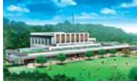
だれでも楽しく利用できる還元施設「環境の杜ふれあいセンター」(南風原町字新川)

古都首里・弁ヶ嶽南側の緑豊かな自然が残る丘陵地にできる施設です。新ごみ処理施設の発電室、トレーニング室、温浴室、トレニング室、環境学習室、屋外多目的広場などを備え、周辺自然環境にも配慮した、子どもからお年寄りまで楽しく利用できる、開放的で地域に根ざした施設です。