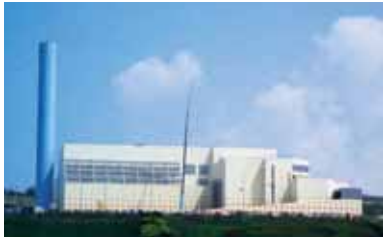
廃棄物発電も備えた新ごみ処理施設「那覇・南風原クリーンセンター」(南風原町字新川)

那覇市・南風原町ごみ処理施設事務組合が全国対象に募集していた新環境3施設の愛称が、319件の中から厳正な審査の結果決定されました。那覇市・南風原町ごみ処理施設事務組合(833-6672) 新ごみ処理施設「クリーンセンター」 一日当たり450トンのごみを燃やす性能を備えた県内最大の施設です。来年4月に本格運転しますが、ことし12月の試運転から那覇市と南風原町のごみを処理することになります。循環型社会の推進を念頭に、石油・石炭などの天然資源の使用を削減し、廃棄物発電の導入によるエネルギーの有効利用を図りました。