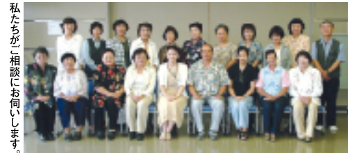
私たちが相談にお伺いします。

見かけたらぜひ気軽に声をかけてください。 ※上記の市民介護相談員の派遣や介護に関するご相談は、那覇市基幹在宅介護支援センター(市民介護相談員事務局)へお問い合わせください。 お問い合せ 基幹在宅介護支援センター ☎951-3266 (新都心銘苅庁舎2階)