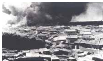
辻原から見た炎上している那覇港一帯

昭和19年10月10日の早朝、当時の小禄飛行場や那覇港が空襲に遭いました。その後、5波にわたって空襲が続き、260名の尊い生命が奪われ、旧那覇市内の9割までもが消失しました。 市では、60年という節目の年であり、飛行場や港を望めるがじやんびら公園で、戦争の風化を防ぎ、次代までも記憶するために「十・十空襲60周年・市民の集い」を開催します。なお、当日 は、大綱挽垣花実行委員会が、昭和10年以来、68年ぶりに復活させた「球陽」の旗頭を押し立てて、鎮魂の意を表すことになっていきます。また、「お役所ライブ」を活用してのこもった古典音楽の演奏も予定しています。ご家族そろってご参加ください。 市民平和交流室 ☎898-3003