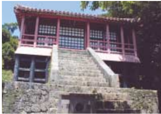
2 末吉宮跡 琉球八社(末吉宮、沖宮、波上宮、天久宮、安里八幡宮、識名宮、普天間宮、金武宮)のひとつで、戦前は国宝に指定されていたが、第二次世界大戦で砲撃を受け昭和47年に復元されました。