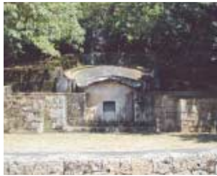
1 宜野湾御殿のお墓及び墓域 壮大な優雅な形をしているこのお墓は、亀甲(カミイヌク)墓がつくられはじめて間もない18世紀初期のもの。琉球王府時代の典型的な王子墓で、周辺の石畳道などから王府時代の墓制を今に伝える価値ある文化遺産です。

県の鳥獣保護特別地区に指定されている末吉公園は、市内で自然林が残されている唯一の公園です。中央には安謝川が流れ、自生、生息する動物植物などが観察できます。 また、歴史をしのばせる史跡も残されており「宜野湾御殿のお墓」や「末吉宮跡」は美しい景観を残し、末吉町の地域住民のみならず、観光客に感じさせます。末吉公園は、野生の動植物が共生する森です。散策や自然観察の際は、ハブや虫に注意し、ごみはきちんと持ち帰り、みんなが気持ちよく利用できるよう楽しんでください。