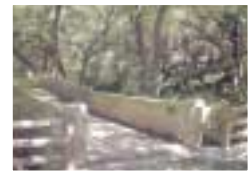
3 滝見橋 生活廃水を源流とする安謝川は、末吉の森を通ることで浄化され、下流へと流れていきます。ホタルの観察スポットとしても滝見橋周辺はおススメです。