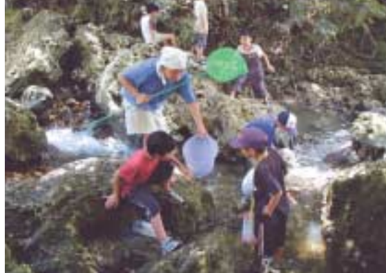
5 花見橋周辺 ザリガニを捕まえてはやく子どもたち、園内を流れる安謝川では、いろんな生物と触れ合えます。