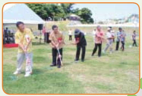
8月1日(日)に行われた、グラウンドゴルフとサッカーによる始球式。