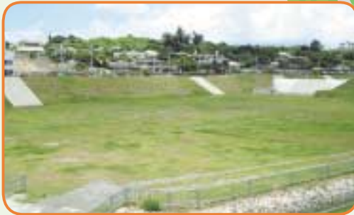
いちばん広い下池広場ではミニサッカーや少年野球の他、地域のコミュニケーションの場としてのイベントにも活用できますね。