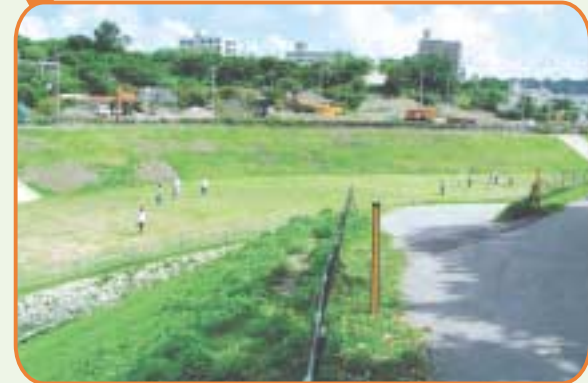
タテに細長い中池広場は、グラウンドゴルフなどの競技に最適です。