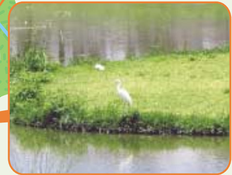
上池には常時、水が溜まっており、魚をねらうダイサギも訪れていました。