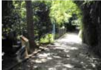
島添坂(シマシーピラ)