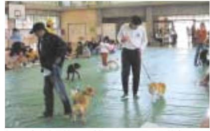
大道小学校での動物ふれあいしつけ教室の様子

※市では、捕獲・引取りの犬やねこは、沖縄県動物愛護センターへ持ち運ぶため、譲渡・処分の件数はありません。