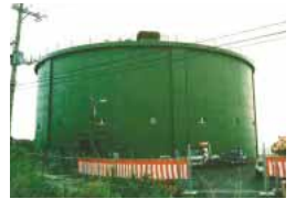
新川配水池 (南風原町)