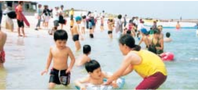
那覇で唯一のビーチ、「波の上ビーチの海開き」は4月4日(日)に開催!