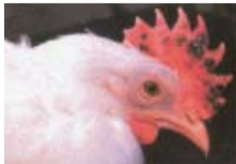
とさかの出血・え死