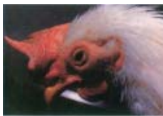
顔面のむくみ・はれ

〒900-8585 那覇市泉崎1-1-1 経営企画部経営企画室 ☎098-862-9937 FAX098-862-4263 ㊟アドレス:m-chosei001@neo.city.naha.okinawa.jp