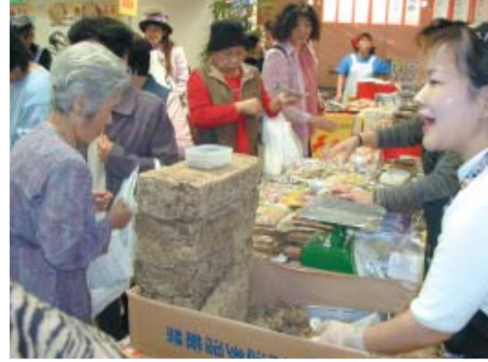
黒糖カチ割り、マグロ解体の実演などのほか、今回はゆいレール開通半年記念として、各駅周辺にある老舗や話題の店が紹介されました