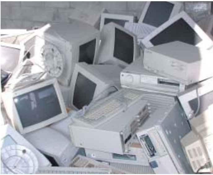
きちんとリサイクルすると、使用済みパソコンは「資源」に生まれ変わります