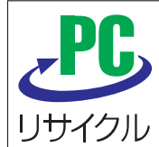
このマークがPCリサイクルマークです。

PCリサイクルマークがない製品については、各メーカーに申込み後、所定の方法(郵便振替、銀行振込、クレジット、コンビニなど)で、回収再資源化料金を支払います。支払後に専用エコゆうパック伝票が送られて来るので、梱包して郵便局に出すか、戸別に回収してもらってください。