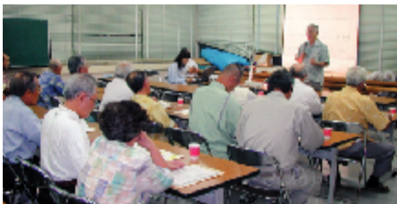
首里地区で行われた「屋上緑化説明会」(6月3日・首里支所)