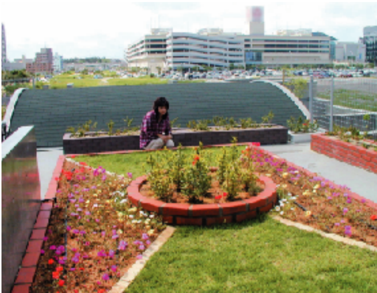
コバノサンダンカ、マツバボタン、芝などが植栽された那覇市緑化センター屋上の緑化モデル。那覇市屋上緑化見本市で公開されます(那覇新都心天久公園)