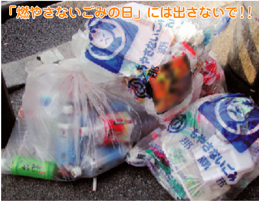
「燃やさないごみの日」には出さないで!!

左のごみ袋はちゃんとペットボトルだけで分別されていますが、キャップがはずされています(キャップはもやさないごみです)。また、この日は「燃やさないごみ」の日でしたので、曜日間違いでペットボトルは収集されません。ペットボトルは「かん・びん・ペットボトル」の日に出してください。