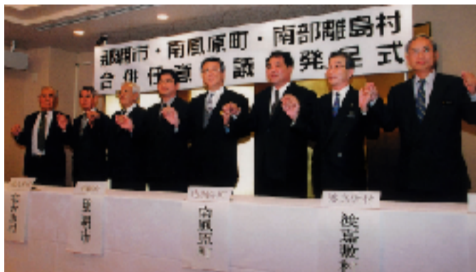
「覚書」を締結し、互いに手を握り合う8市町村長(市内ホテル・2月5日)

那覇市と南風原町、南部離島6村(渡嘉敷村、座間味村、粟国村、渡名喜村、南大東村および北大東村)の合併について調査・研究するため2月5日、「那覇市・南風原町・南部離島村合併任意協議会」が発足しました。