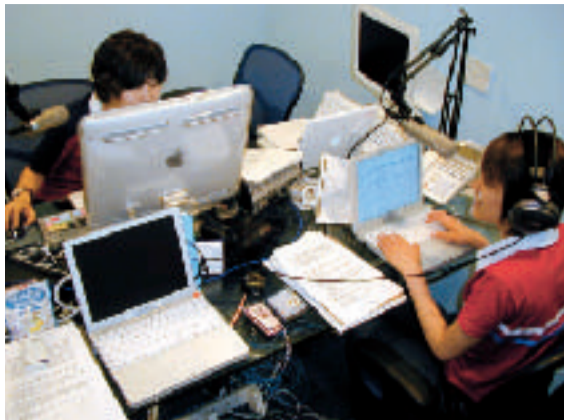
国際通りのスタジオから那覇市の情報を発信します