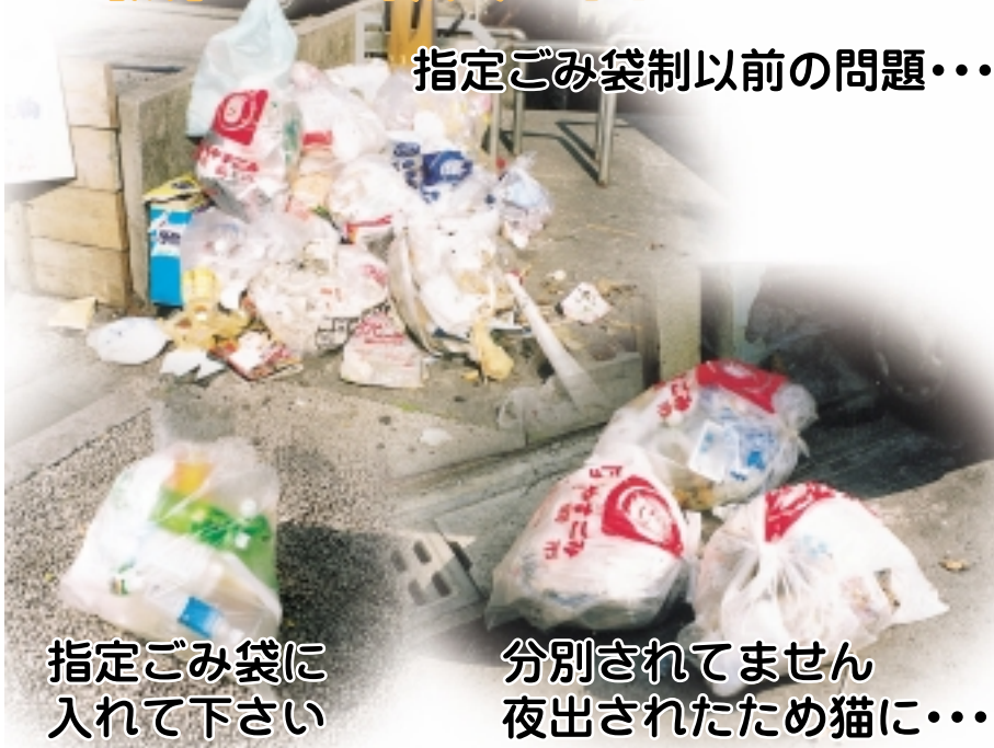
指定ごみ袋制以前の問題・・・