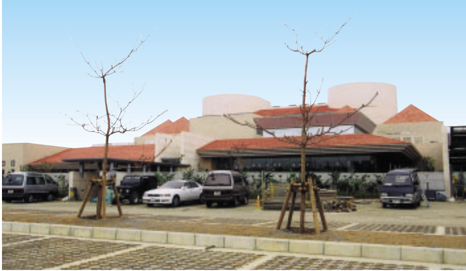
最新技術を結集し、低公害の火葬炉を設置した公営斎場のなつら斎苑