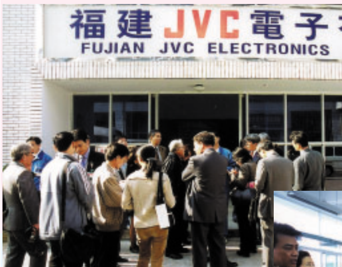
福建JVC電子有限公司の工場内を見学する訪問団