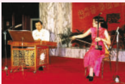
記念祝賀会では両市の伝統芸能が披露されました