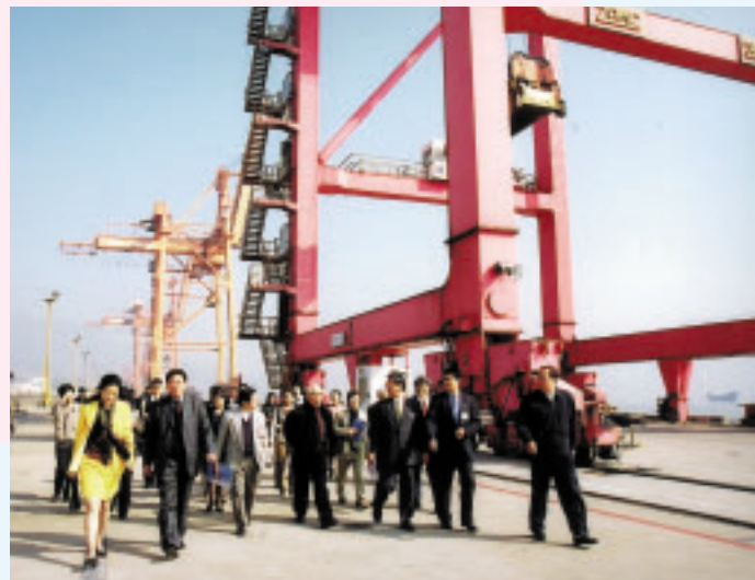
海上輸送のターミナルとなるコンテナバースには巨大なクレーンが立ち並んでいます