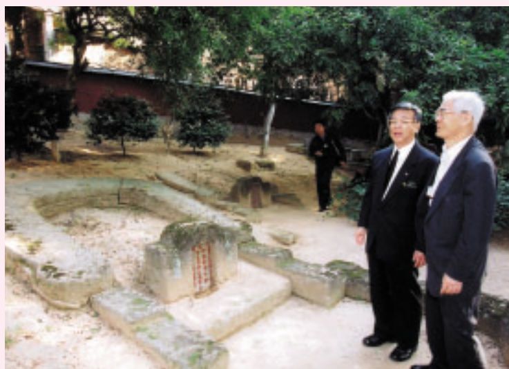
琉球人墓地の亀甲墓。福州市の文化財に指定されています