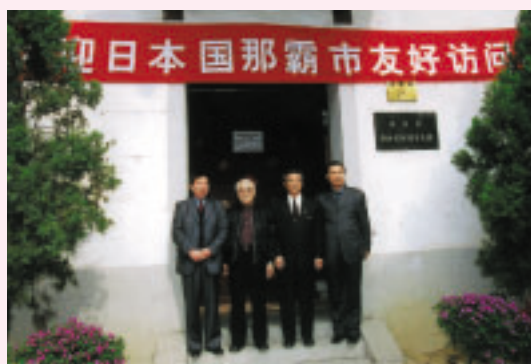
那覇市に福州園が建設されたことを記念して復元(1992年)された琉球館