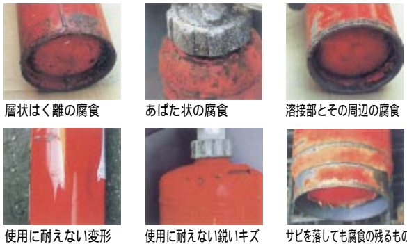
層状はく離の腐食、あばた状の腐食、溶接部とその周辺の腐食、使用に耐えない変形、使用に耐えない鋭いキズ、サビを落しても腐食が残るもの

練等も含め使用しないこと。 定期的な点検を行うこと。 注(1)引き取りを行っている事業者、社団法人沖縄県消防設備保守協会 0853-6059 廃棄処理費用は、1,000円程度ですが、大きさや本数、運搬等の状況により異なりますので直接事業者と相談してください。 お問い合わせ先 消防本部予防課 0867-0212