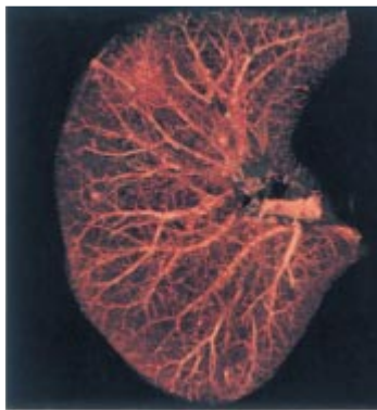
CT肺線維 微小肺ガンの早期発見が大きく期待されます。

那覇市立病院では平成13年4月から世界最高水準のマルチスライス技術を搭載したマルチヘリカルCTを導入しました。 県内各病院で設置されているおもなCT機は「ヘリカルCT」です。 90年代に入って急速に普及してきた機種で、今までの機種より撮像(影)時間の大幅な短縮が可能になりました。 市立病院では、今回、最新技術とコンピュータの情報革新を取り入れられた、新世代の「マルチヘリカルCT」を2機めの機種として導入しました。 医療機器も年々、改良され、高度な検査が行なえるようになり、導入したことで、患者さんの負担を最小限にとどめる検査が可能になり、画像処理能力の向上により多方向からの画像再構築や立体画像表示などの各種の情報が、手軽に得られるようになりました。 患者さんの症状に応じて、心臓血管のみ、骨格のみの立体画像や胃腸・気管支を内部から観察する仮想内視鏡画像も実用化しました。 これまでのCTでは困難だった三次元画像が短時間で可能になりました。