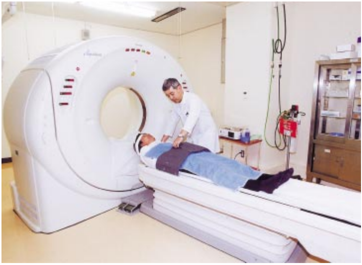
最新機「マルチヘリカルCT」では、たった1回の息どめで胸部から骨盤までの体全体を撮像することが可能です。

那覇市立病院では平成13年4月から世界最高水準のマルチスライス技術を搭載したマルチヘリカルCTを導入しました。 県内各病院で設置されているおもなCT機は「ヘリカルCT」です。 90年代に入って急速に普及してきた機種で、今までの機種より撮像(影)時間の大幅な短縮が可能になりました。 市立病院では、今回、最新技術とコンピュータの情報革新を取り入れられた、新世代の「マルチヘリカルCT」を2機めの機種として導入しました。 医療機器も年々、改良され、高度な検査が行なえるようになり、導入したことで、患者さんの負担を最小限にとどめる検査が可能になり、画像処理能力の向上により多方向からの画像再構築や立体画像表示などの各種の情報が、手軽に得られるようになりました。 患者さんの症状に応じて、心臓血管のみ、骨格のみの立体画像や胃腸・気管支を内部から観察する仮想内視鏡画像も実用化しました。 これまでのCTでは困難だった三次元画像が短時間で可能になりました。