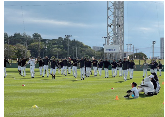
朝のグラウンド体験

期間 2.16(金) ▶ 2.28(水) ※休養日:20(火)、26(月) 会場:奥武山公園