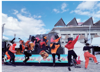
ステージイベント

球場の外野芝生に入って選手気分を味わえる夢のひとつ。ウォーミングアップ中の選手を間近に見ることができます!