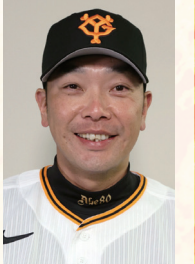
阿部 慎之助 監督

昨季は大変悔しい思いをしたシーズンでしたが、今季は球団創設90周年という節目の年です。阿部新監督のもと、チーム一丸となって優勝、日本一を目指して頑張ります。