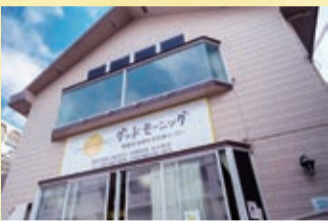
地域生活支援センターグッドモーニング 所 長田1-24-27 ☎836-0878 【開所時間】9時～19時(年中無休) *相談支援は9時30分～17時

※令和6年4月1日に「改正障害者差別解消法」が施行され、事業者による障がいのある人への「合理的配慮の提供」が義務になります。