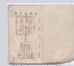
▲楚南家の家宝 馬の角 ▲楚南家の家宝 自姓家譜