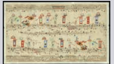
▲作者不詳「那覇四町綱之図」(19～20世紀)

琉球王国時代から行われていた那覇の大綱挽、その様子を描いたのが「那覇四町綱之図」です。琉球王国時代の那覇は、東・西・若狭町・泉崎の4つの村で構成され、これらを那覇四町と呼んでいました。綱引きの時は、東村・西村を主催とし、若狭町村は東村へ、泉崎村は西村へ加勢し綱を引きました。中央に置かれた綱の周りには、旗頭を掲げた大勢の綱引き行列の人々が描かれています。他にも、旗頭の周りで太鼓を叩く人やはやしたてる人、それを眺める見物人など様々な動きをしている人々を見ることができ、色とりどりの旗頭が立ち並ぶ、王国時代のにぎやかな那覇の祭りの様子が伝わってきます。