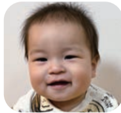
りょうま 我謝 りょうま ちゃん 令和4年8月(古波蔵在住)