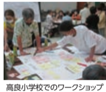
高良小学校でのワークショップ

◆小学校区まちづくり協議会ってなに? 市では、市内各36小学校区を範囲とした協議会による地域運営を推進しています。令和5年8月現在、15の小学校区で協議会と準備会が結成され、地域に住む人、活動する団体、企業のみならず、地域の課題解決や繋がりのために活動しています。また、協議会未設立の校区でも立ち上げに向けた、ワークショップなどを開催しています。