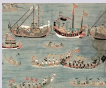
那覇港内でのハーリー競争の様子 「琉球貿易図屏風」(部分) 滋賀大学経済学部資料館所蔵