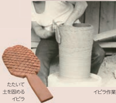
たたいて土を固めるイビラ イビラ作業