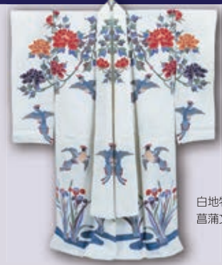
白地牡丹尾長鳥流水 菖蒲文様紅型木綿衣裳